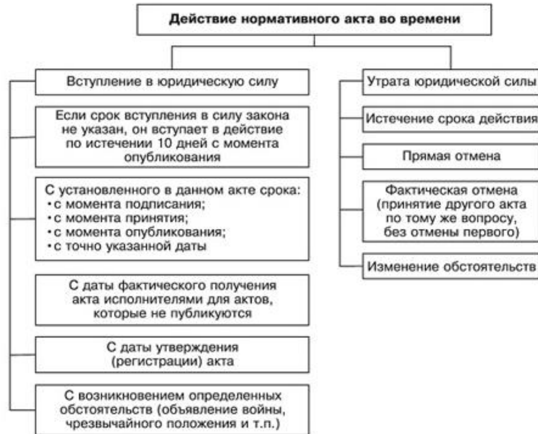
Рис. 19. Действие нормативного акта во времени